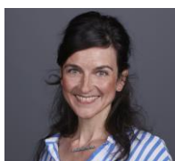
Frau Bischatka Gemeinschaftsschule Grüner Campus Malchow