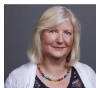
Frau Heck Vorstandsmitglied Paul-und-Charlotte- Kniese-Schule