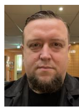
Herr Dolny Adam-Ries-Schule