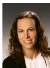
Frau König Matibi-Schule