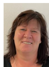
Frau Mühlenbeck Schmetterlings- Grundschule