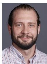
Herr Bode George-Orwell-Schule