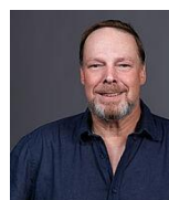
Herr Weise Carl-von-Linné- Schule